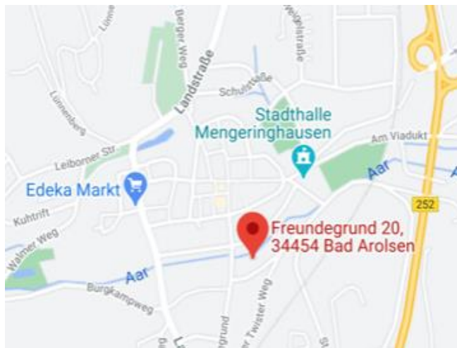
Google Maps, März 2021

Die Evangelische Kindertagesstätte „Regenbogen“ befindet sich gegenüberliegend der Evangelischen Kindertagesstätte „Arche“ im Freundengrund in Mengersinghausen.